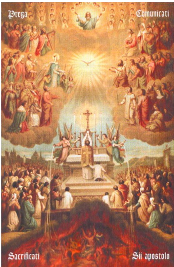
Dâng Lễ: Giây phút kỳ diệu